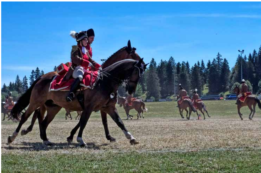
Das Cadre Noir et Blanc sorgte an seiner Vorführung in der Arena für viel Abwechslung und spannende Formationen.